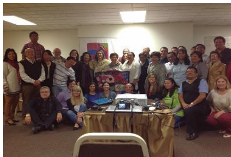
Participantes de 14 de las 16 coaliciones y partidarios de CLADE

education' (la laicidad en la educación) de una perspectiva de educación como derecho humano fueron inputs entradas importantes para la preparación de la AG y se elevaron un debate animado.