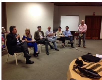
Plan Internacional, IBIS, Action Aid and otros de los partidarios de CLADE en discusión sobre la colaboración internacional con Latinoamérica.